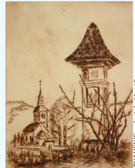
ZNAMENJE, suha igla 20 x 17 cm