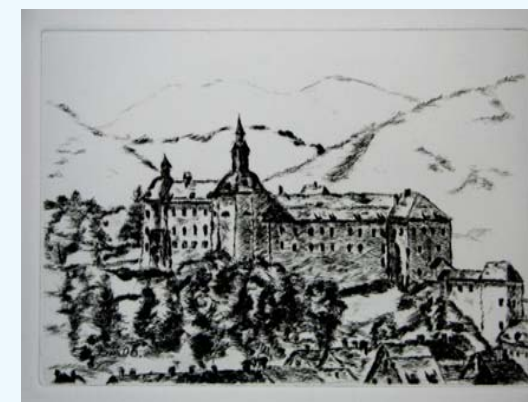
LOŠKI GRAD, suha igla 20 x 30 cm

S svojimi deli je že skupinsko razstavljal v: Inštitutu RS za rehabilitacijo invalidov, Zdravilišču Laško, Galeriji COMMERCE Ljubljana, Galeriji Vipavski križ, Taborski hiši Semič, Unionski dvorani Maribor in Delavskem domu Trbovlje.