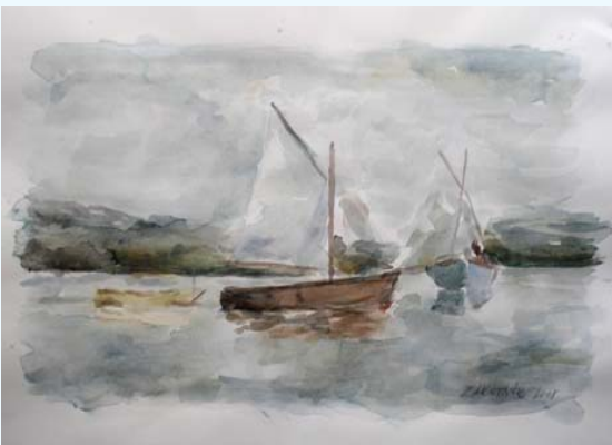
NA BARKI, akvarel 29 x 42 cm

Morda je doba slikovitega razvoja tehnike in nenehnih sprememb v kateri živimo, kriva, da ljudje vedno bolj iščejo svoj notranji mir v naravi, v duhovnem svetu, kulturi in pogosto tudi v njeni hčeri – umetnosti. V takem ozračju raste tudi število ljubiteljskih umetnikov, ki jih k delu spodbuja spoznanje, da je komaj katera dejavnost tako sproščujoča kot je ravno likovna, spoznanje, ko človek v sliko, kip, grafiko itd., položi vse tisto kar ga vznemirja in teži, zraven pa izrazi tudi svoje predstave o svetu, življenju in o sebi.