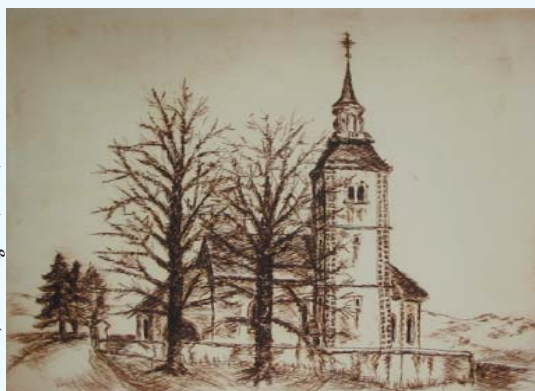
SUHA, suha igla 21 x 27 cm