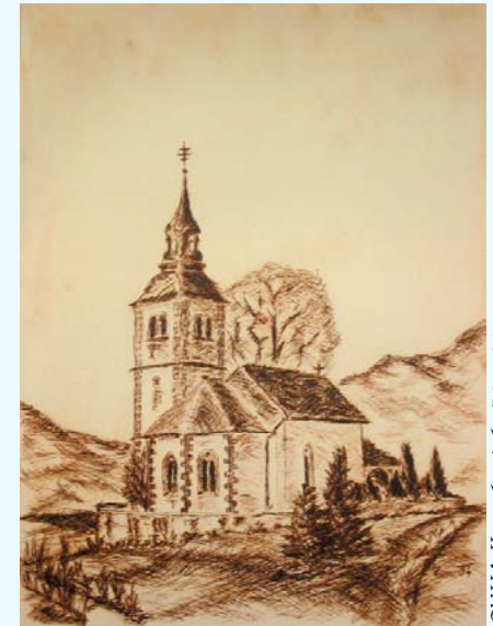
SUHA II., suha igla 30 x 21 cm