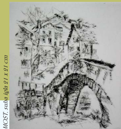
MOST, suha igla 21 x 21 cm