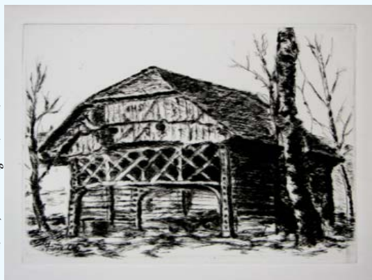
TOPLAR, suha igla 20 x 23 cm