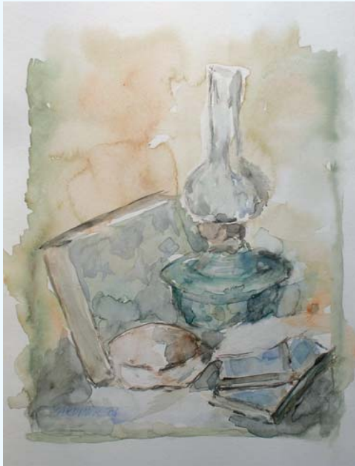
TIHOŽITJE, akvarel 35 x 25 cm