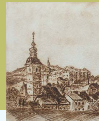
ŠKOFJA LOKA, suha igla 20 x 17 cm