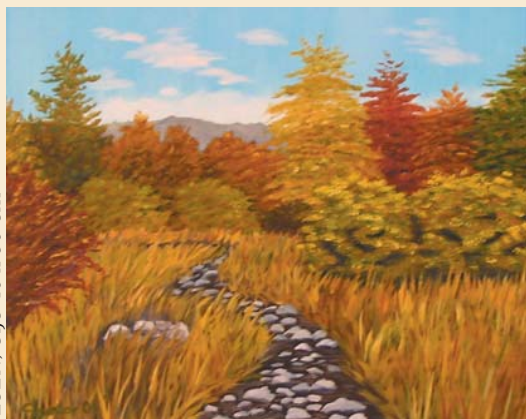
JESEN, olje 40 x 50 cm