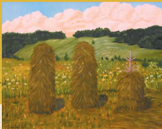
OSTRGAČE, olje 40 x 50 cm