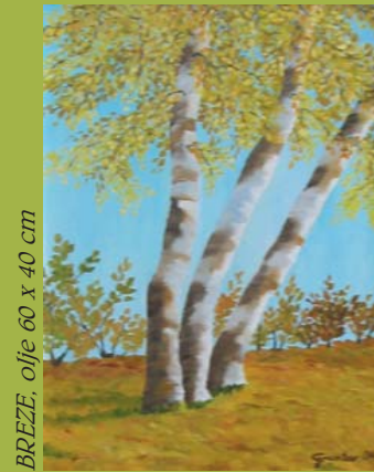
BREZE, olje 60 x 40 cm

Umetnostni zgodovinar, Prof.dr.Mirko Juteršek