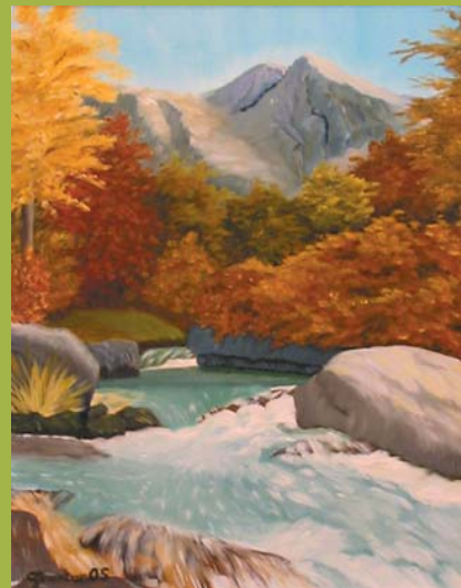
REKA ZADNICA, olje 40 x 50

Zveza paraplegikov Slovenije Štišova 14, 1000 LJUBLJANA TEL. 01 4327 138, FAX 01 4327 252 www.zveza-paraplegikov.si zveza.paraplegikov@guest.arnes.si