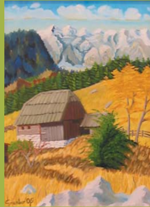
DOMAČIJA V TRENTI, olje 50 x 40 cm