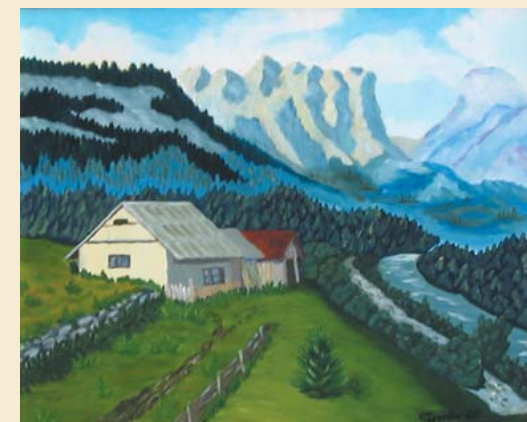
MANGARTSKA PLANINA, olje 50 x 60 cm