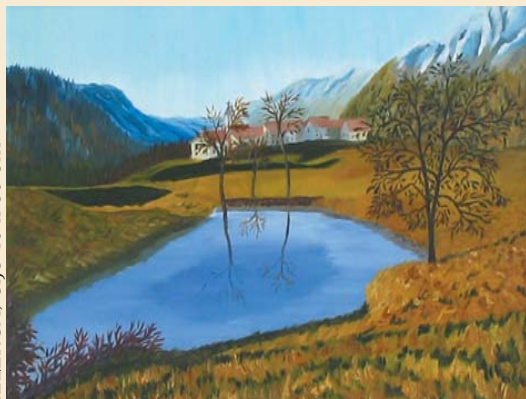
JEZERCA, olje 40 x 60 cm