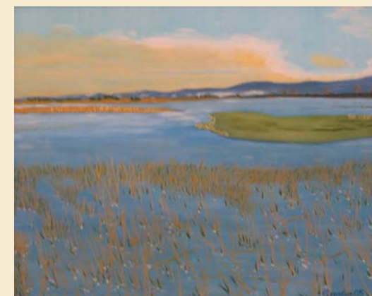
CERKNIŠKO JEZERO, olje 50 x 60 cm