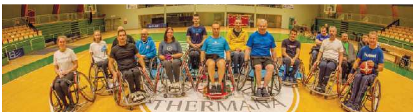
Prijateljska tekma v Thermani Laško

V eseli smo, da smo tudi letos nadaljevali z našim tradicionalnim srečanjem z zaposlenimi Thermane Laško, ko smo se v športni dvorani Tri lilije v Laškem meseca oktobra pomerili v košarki na vozičkih. Tekma ni potekala med nami in njimi, ampak smo se razdelili v dve mešani ekipi. Lahko zapišem, da so z leti postali že prav spretni v obvladovanju košarkarskih vozičkov. Tekma je bila