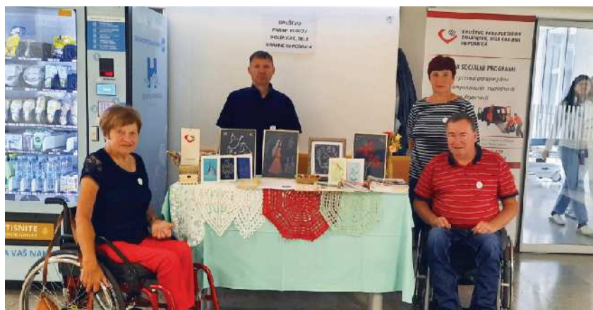
Naša stojnica na Dnevu odprtih vrat