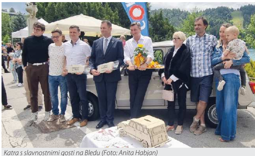
Katra s slavnostnimi gosti na Bledu