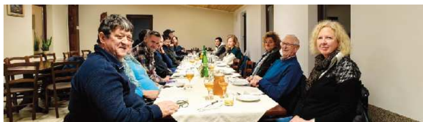
Sv. Martin, mošt spremeni v vin !

I 1. novembra, na praznik sv. Martina, smo člani severnoprimske družčine krenili do domačije Abram na tradicionalno martinovo pojedino. V lepem številu smo napolnili prostor, ki so ga gostitelji pripravili za nas in se prepustili njihovi gostoljubnosti, prijaznosti, predvsem pa domačim okusom, ki so nam jih pričarali na