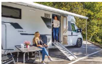
Avtodom omogoča letovanje tudi osebam na vozičku.

N a Društvu paraplegikov jugozahodne Štajerske smo v spomladanskih mesecih skupaj s podjetjem najemipoceni.si uspeli kupiti bivalno kombinirano vozilo oz. avtodom, ki smo ga nekoliko prilagodili za uporabnike na invalidskih vozičkih. Vanj je vgrajena ročica za ročno upravljanje in klančina. Ideja je bila, da se avtodom na začetku prilagodi s čim manjšimi posegi in da ob odstranitvi prilagoditev ni vidnih poškodb na vozilu zaradi lažje nadaljnje prodaje. V prvi sezoni smo želeli preveriti trg in zanimanje za najem takšnega vozila med paraplegiki. Vozilo je bilo zasedeno v