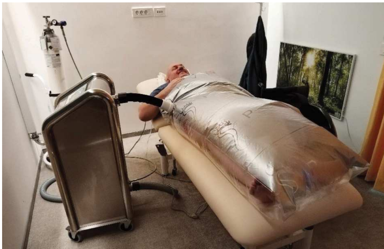
Terapija, ki zdravi, zmanjša ali odstrani simptome zmanjšane prekrvavitve.