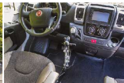
Avtodom je prilagojen za ročno upravljanje.

veliki meri skozi celotno poletno sezono, v septembru in med jesenskimi počitnicami. Sedaj se pripravljamo na zimsko sezono – na smučanje z avtodomom, kar je svojevrsten izziv in nova avantura. Glede na uspešno poletno sezono je dozorela ideja, da v prihodnje