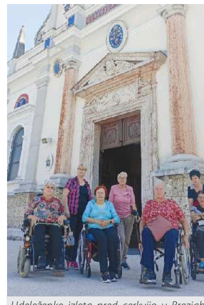
Udeleženke izleta pred cerkvijo v Brezjah