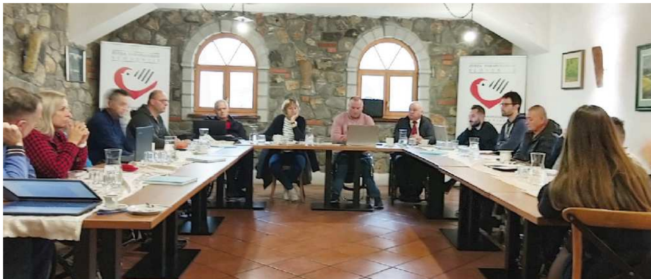
Posvet športnih referentov pokrajinskih društev

Uskladiti je bilo treba vsa ligaška tekmovanja s po tremi ali štirimi krogi (atletika, košarka, kegljanje, streljanje, športni ribolov, šah ...), tekmovanje v Regionalni NLB Wheel ligi, mednarodna tekmovanja, svetovna in državna prvenstva, ki jih organizira Zveza za šport invalidov Slovenije, in različna društvena tekmovanja ter športna srečanja. Določiti je bilo potrebno še nosilce oz. soorganizatorje posamičnih tekmovanj in prizorišča.