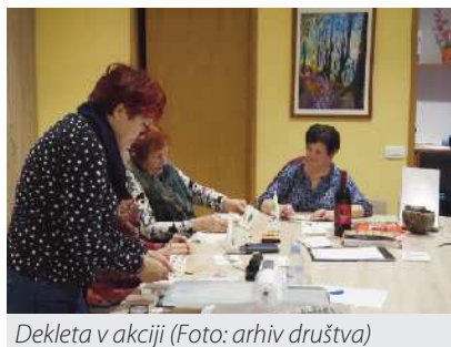
Dekleta v akciji

Tudi letos so naša pridna dekleta, članice ženske sekcije društva, organizirale delavnice izdelovanja novoletnih voščilnic. V novembru so se zbrale na društvu in