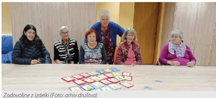
Zadovoljne z izdelki

pod vodstvom mentorice Sonje Rojc izdelale čudovite voščilnice. Ob tem so poskrbele za obilo smeha in zabave, tako da jim je čas še prehitro mineval.