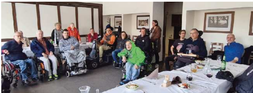
Članice in člani, ki živijo v južnem predelu Ljubljane.

Za utrjevanje boljših vezi pa poverjeniki enkrat letno s svojimi člani pripravijo družabno srečanje, na katerem si v sproščeni pogovoru izmenjajo koristne izkušnje. Predvsem