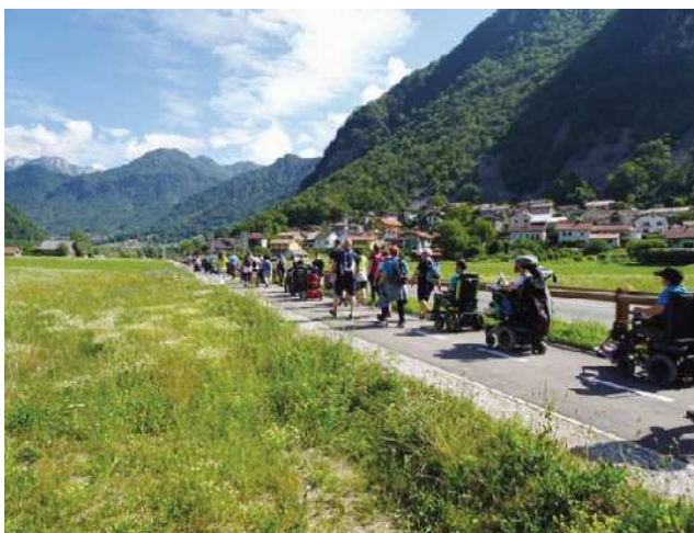
Pohodniki v dolini Soče

Veliko jih je po krepčanju krenilo še dalje po grebenu Kolovrata, drugi pa so si krajšali čas z balinanjem ali s plesom. Po prihodu druge skupine pohodnikov, sestavljenih večinoma iz slepih in nevrorazličnih, ki so šli do prelaza Solarij, so predstavniki odbora in akcij pozdravili vse udeležence. Ko smo gibalno ovirani krenili na zborna mesto, so pohodniki še počivali. Nas pa je v vasi pričakal prekrasen zven zvonov in prijeten pogovor z mlado družino – tujci, ki so tam odkupili