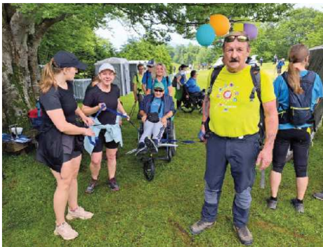
Končno pred kočo