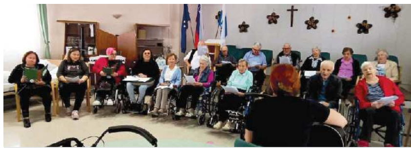
Naše recitatorke in domski pevski zborček so oskrbovancem doma popestrili dan.

Leto 2023 je razglašeno za leto Karla Destovnika - Kajuha . Kljub njegovi kratki življenjski poti je Kajuh vidno zaznamoval slovenski kulturni prostor. Zaradi svoje prezgodnje smrti ni ustvaril veliko pesmi, vendar je v svoji poeziji z izjemno jasnostjo in izrazno močjo izpovedal občutje sveta, ki je bilo značilno za velik del njegove generacije. Kajuh je vsebine svojih