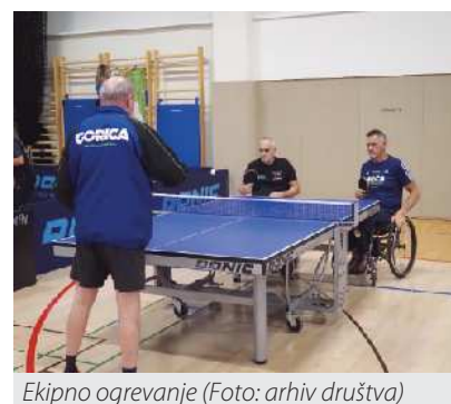
Ekipno ogrevanje

Zadovoljni in polni novih doživetij smo se pozno popoldan odpravili