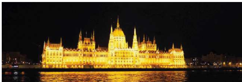
Čudoviti pogledi na parlament Budimpešte z ladjice

Po poznem kosilu nas je zopet čakala mirna vožnja proti domu. Ko je sonce zahajalo, smo parkirali društveni kombi pred društvom in takrat se je naša dogodivščina varno končala. Domov smo prispeli utrujeni, a polni spominov in prijetnih vtisov. Budimpešto smo pustili za sabo in čeprav bi z veseljem preživali tam še kakšen dan, nas že čakajo novi podvigi, dogodivščine, izleti in mi Primorci se jih prav nič ne bojimo.