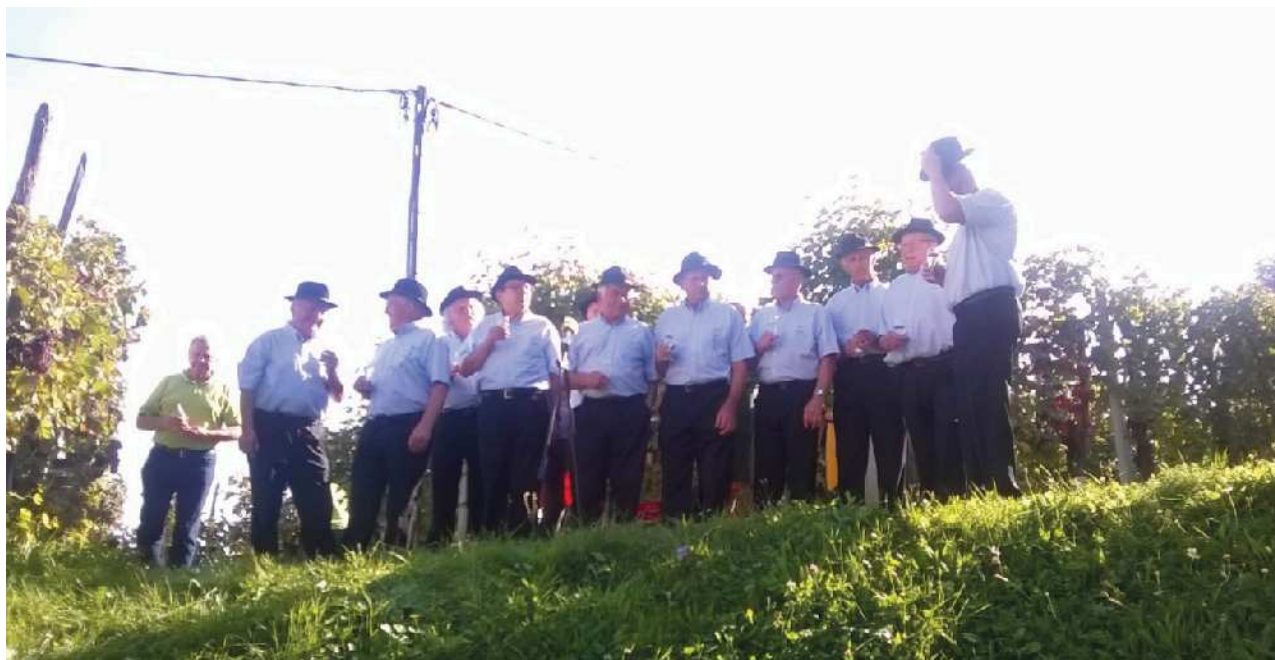
Moški pevski zbor Semiški klobukarji

vodja kulturnih dejavnosti Zveze paraplegikov Slovenije Metod Zakotnik , ki se je zahvalil za povabilo na trgatev.