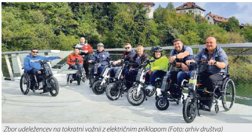
Zbor udeležencev na tokratni vožnji z električnim priklopom

Za naše člane smo v oktobru po Novem mestu organizirali vožnjo z električnimi priklopi za invalidske vozičke. Zbrali smo se na parkirišču društva in se skupaj podali po dostopnih poteh po mestu. Najprej smo prečkali novo brv (Štukljeva brv) za pešce in kolesarje preko reke Krke v Irči vasi proti Bršljinu in naprej proti centru mesta. Na Glavnem trgu smo se okrepčali s kavo in pijačo, se ustavili pred Rotovžem in nadaljevali pot proti drugi novi Julijini brvi, po Župančičevem sprehajališču ob Krki, na Loko. Od tam pa nazaj proti društvu, kjer so udeleženci izkoristili čas še za druženje. Pot je bila dolga okoli 10 kilometrov. Vožnje se je udeležilo 8 invalidov s priklopi in spremljevalci. V sodelovanju s podjetjem RTS Medical d. o. o. pa smo članom, ki nimajo električnih