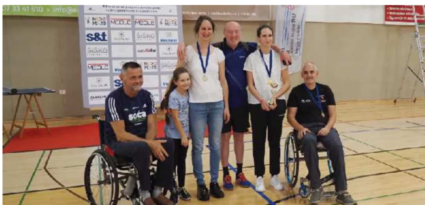
Skupinska slika z okraski okrog vratu

proti domu. Razšli smo se v upanju in pričakovanju, da se na takih in podobnih dogodkih kmalu spet vidimo.