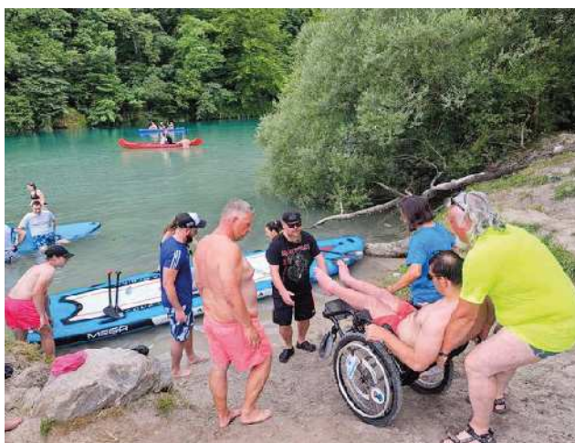
Pomoč pri prestopu na SUP