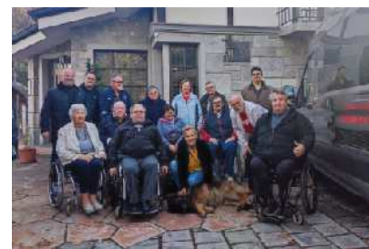
Izlet pevcev po Slovenj Gradcu