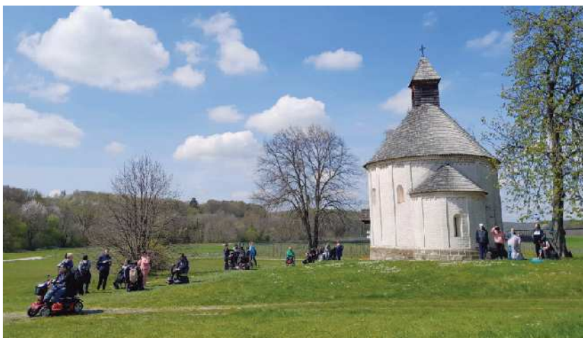
Pri rotundi

Poleg tega je bil dogodek tudi dobrodelen, saj so se zbrana sredstva namenila za izvajanje različnih dejavnosti za ljudi s posebnimi potrebami.