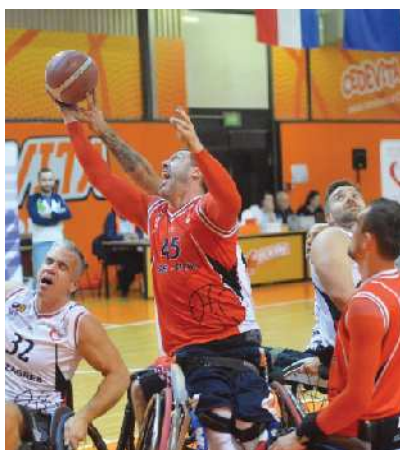
Ekipa Paraspport Slovenia je v prvem krogu zmagala na obeh tekmah.

V drugi tekmi sta se pomerili KKI Zagreb in KKK Singidunum. Gostitelji, okrepljeni z nemškim igralcem Sebastianom Magenheimanom , so v prvem polčasu (27 : 37) morali priznati premoč beograjskim igralcem. Toda v košarki je vse mogoče. Hrvaški igralci so v drugem polčasu naredili preobrat in ob koncu tretje četrtine izenačili in povedli. Tekmo so dobili z rezultatom 55 : 53. V tretji tekmi sta se pod koši srečali Paraspport Slovenia in KIK Zmaj. Prvaki