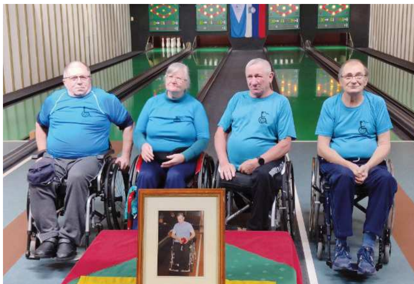
Ekipa društva na 1. kolu lige ZPS v kegljanju