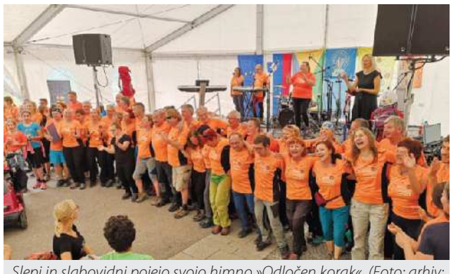
Slepi in slabovidni pejejo svojo himno »Odločen korak«.