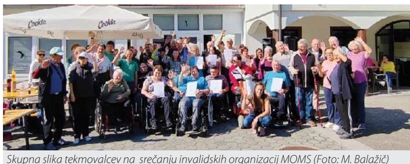
Skupna slika tekmovalcev na srečanju invalidskih organizacij MOMS