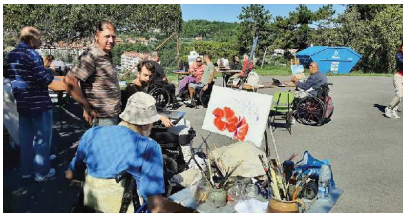
Na župnijskem dvorišču v prekrasnem jesenskem vremenu

Ankaran, majhno obmorsko naselje na slovenski obali, se je nedavno zbudilo v izjemno ustvarjalno vzdušje. Župnijsko dvorišče je gostilo priljubljeno likovno delavnico, ki je privabila številne ljubitelje umetnosti različnih starosti in invalidnosti.