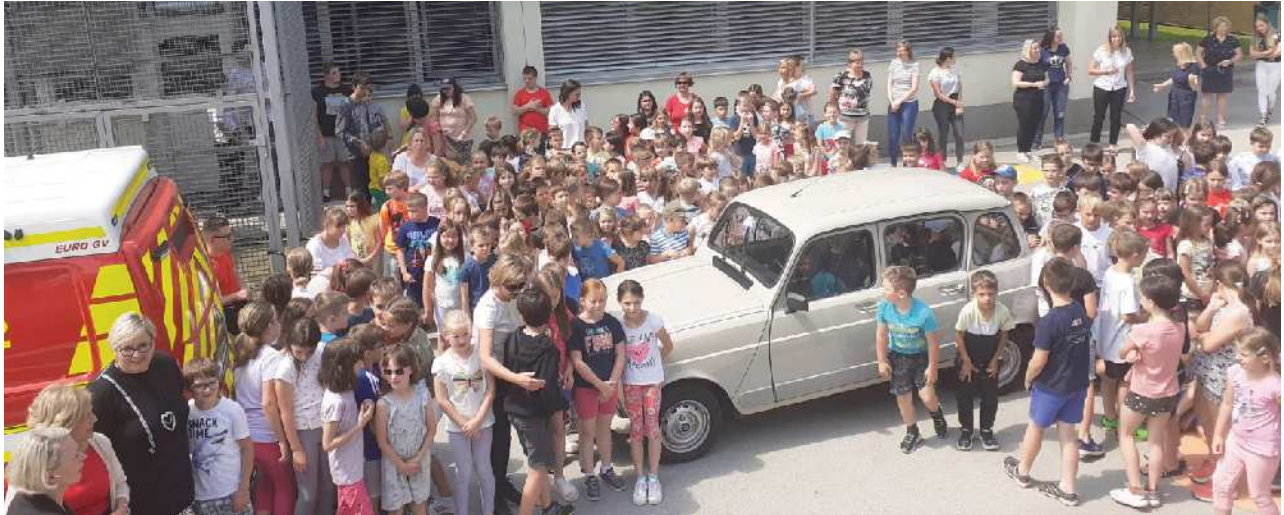
Katra z otroki v Krškem

njenem računu pri RK Škofja Loka pa se je znesek ustavil pri 34.921 evrov. Po dogovoru je Zveza paraplegikov Slovenije prejela polovico, se pravi 17.460 evrov. Ta sredstva so bila namenjena pomoči pri nakupu CO2 aparata. Terapijo s CO2 so to poletje številni udeleženci obnovitvene rehabilitacije v Pacugu že koristili. Tja pa se je na obisk pripeljala tudi katra. Počitek po tej akciji ni bil dolg, saj so Slovenijo v avgustu prizadele hude poplave, zato katra skupaj z lastnikom že nadaljuje z zbiranjem sredstev. Septembra je bila na Šuštarski nedelji v Trziču, kjer je poskrbela za prevoz Jana Plestenjaka na prizorišče, na Soriški planini v okviru Majerskega sejma in spet se je vrnila na Koroško v Slovenj Gradec na Festival drugačnosti, kjer je pomagala Društvu paraplegikov Koroške pri zbiranju sredstev za njihov poplavljeni kombi.