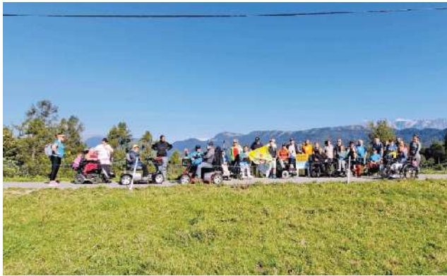
Skupna – lepa, kot hudič.