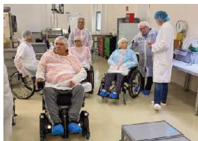
Med ogledom proizvodnje

Ker proizvodnja zahteva čistočo, smo si pred ogledom razkužili roke in dele naših invalidskih vozičkov. Ogled je bil