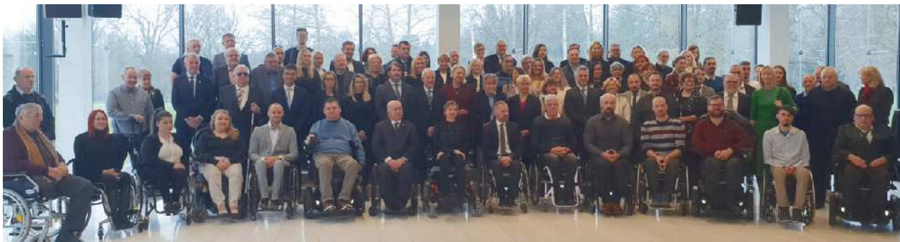
Skupinska slika povabljenih na sprejem ob mednarodnem dnevu invalidov