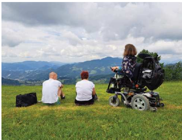
Uživanje v razgledu

konec je delil še znano misel: »Če ti je vseeno, kdaj prideš, ne boš nikoli zamudil in če ti je vseeno, kje si, se ne boš nikoli izgubil.«