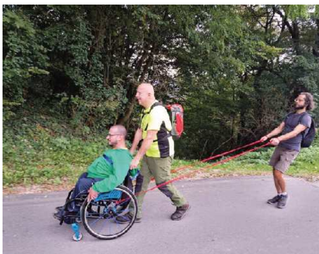
In varno navzdol ...