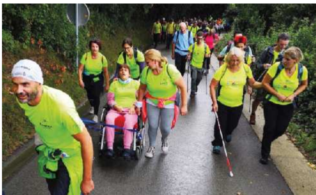
Brez prostovoljcev ne gre.

Ob zvokih ansambla »Zvita feltna« in »Dua Simi« je družčina rajala do večera. Šli smo tudi do obale in se naučili morskega zraka. Deževno jutranje ozračje se je skozi dan prevesilo v ozračje, polno sproščenosti, domačih zvokov,