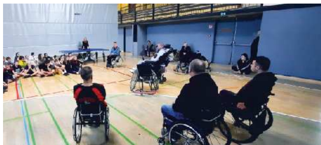
Otroci OŠ Stopiče zavzeto poslušajo.