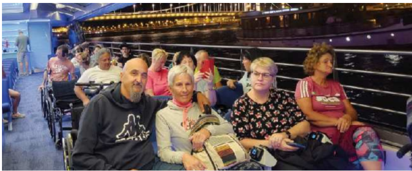
Člani DPSP na ladjici po Donavi

se sprehajali po starih tlakovanih ulicah. Ko je prišel čas za kosilo, smo se zapeljali do ene izmed mnogih tradicionalnih madžarskih gostiln, kjer smo se prepustili vonjavam in okusom madžarske kulinarike. Po kosilu smo se odpravili do dvorca Kiraly, ki je imenovan tudi dvorec cesarice Sissi, saj ji je nekaj časa služil kot počitniška rezidenca. Medtem ko smo se vozili nazaj proti Budimpešti, smo lahko opazovali, kako sonce zahaja in ob prihodu v mesto nas je pričakalo čudovito vzdušje razigranega mesta, ki tudi ponoči nikoli ne spi.