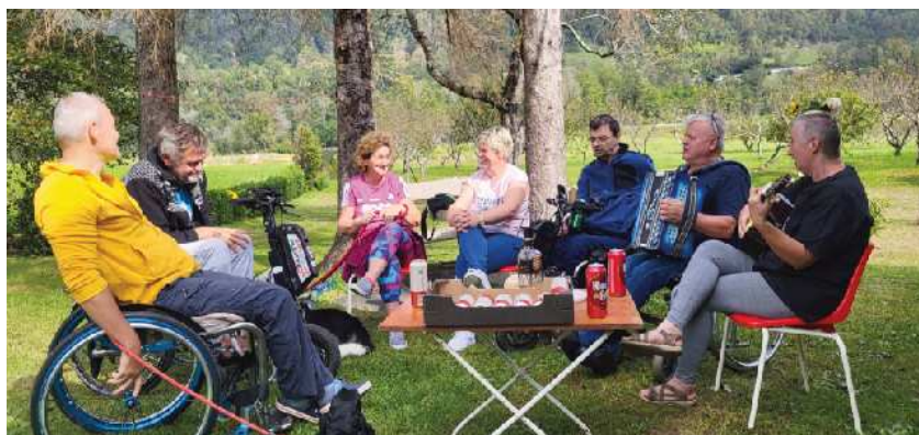
Zbrani na jesenskem pikniku