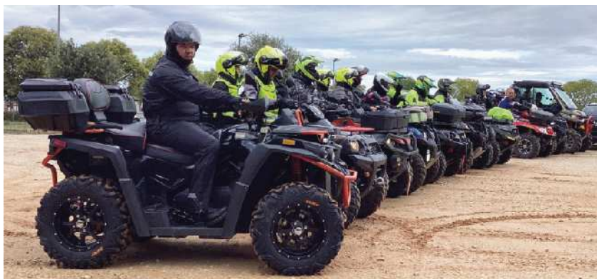
Pred štartom v Pineti

Po odmoru je bila pot vrnitve lažja in krajša. V Pineto smo vsi utrujeni in zadovoljni prispeli malo pred sončnim zahodom. Vremenske razmere tisti dan, čeprav ni kazalo tako, le niso bile