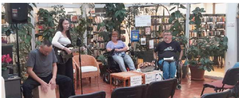
V literarnem večeru predstavitev zbirke Poljub metulja

Pred novo zbirko sta bili izdani že pesniški zbirki Živimo v hiši jezika in Prodajalka želja . Najbolj uspešna je knjiga, proza za otroke, Lečka in Dečka , ki je namenjena otrokom nižjih razredov OŠ. V veliko čast si šteje, ker je bila knjiga uvrščena v tiste