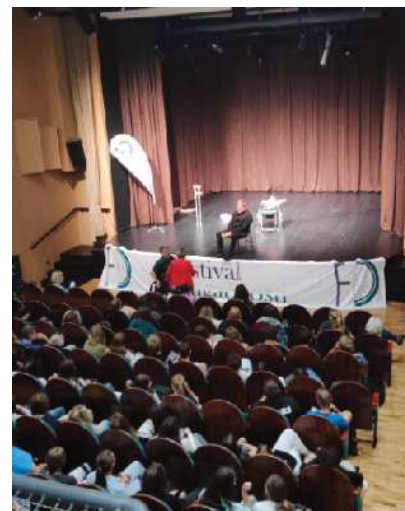
Dvorano Kulturnega doma Slovenj Gradec so napolnili dijaki Gimnazije in Srednje zdravstvene šole, zaposleni v javnih zavodih, občinski upravi in obiskovalci iz humanitarnih in organizacij invalidov.