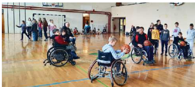
Otroci OŠ Grm se preizkušajo v različnih športih.

Takšne predstavitve s preventivno vsebino so zelo pomembne, saj lahko mladim in ostali javnosti na tak način predstavimo društvo, svoje osebne zgodbe in življenje na invalidskem vozičku, opozarjamo na vse težave in prepreke, s katerimi se srečujemo, od arhitekturnih ovir do vključevanja invalida v aktivno družbeno življenje. Poudarek je predvsem na preventivnem delovanju, saj nesreča nikoli ne počiva in te lahko pripelje do življenja na invalidskem vozičku. Hkrati pa želimo širši javnosti pokazati, da življenje na invalidskem vozičku ni tabu in da so paraplegiki enakovredni člani družbe, ki lahko, kljub invalidnosti, živijo polno življenje.