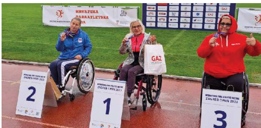
Metoda zmagala v Varaždinu