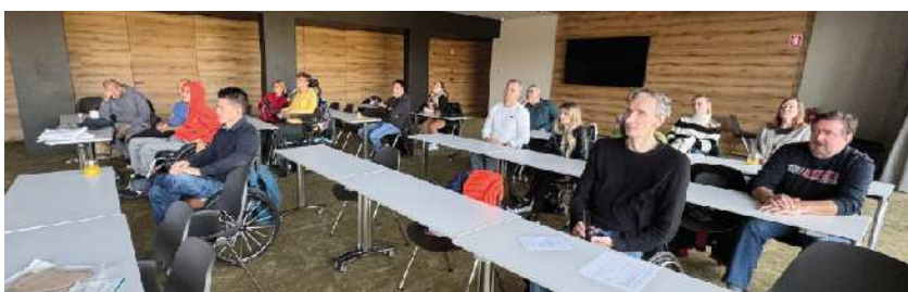
Izobraževanje asistentov in uporabnikov osebne asistencije

Naše poslanstvo temelji na tem, da želimo vedno na prvo mesto postaviti uporabnike, njihove želje in interese, ob tem pa skrbimo, da je delovna sfera primerna in pozitivna tudi za naše zaposlene osebne asistente. Vedno skušamo priti naproti njihovim željam