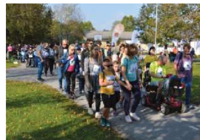
Dobrodelni pohodniki

m, hoja na 500 m ter tek ali hoja na 4 in 8 km. Prireditev je bila zaključena s kratkim kulturnim programom, pogostitvijo in srečelovom.