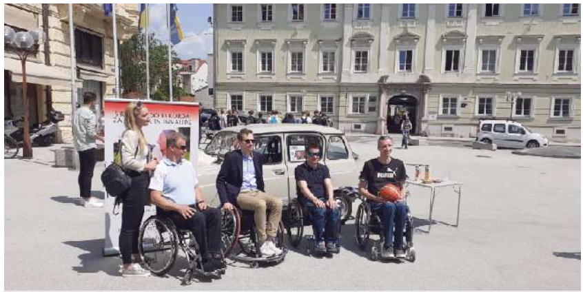
V Celju v družbi paraplegikov celjskega društva

njenem računu pri RK Škofja Loka pa se je znesek ustavil pri 34.921 evrov. Po dogovoru je Zveza paraplegikov Slovenije prejela polovico, se pravi 17.460 evrov. Ta sredstva so bila namenjena pomoči pri nakupu CO2 aparata. Terapijo s CO2 so to poletje številni udeleženci obnovitvene rehabilitacije v Pacugu že koristili. Tja pa se je na obisk pripeljala tudi katra. Počitek po tej akciji ni bil dolg, saj so Slovenijo v avgustu prizadele hude poplave, zato katra skupaj z lastnikom že nadaljuje z zbiranjem sredstev. Septembra je bila na Šuštarski nedelji v Trziču, kjer je poskrbela za prevoz Jana Plestenjaka na prizorišče, na Soriški planini v okviru Majerskega sejma in spet se je vrnila na Koroško v Slovenj Gradec na Festival drugačnosti, kjer je pomagala Društvu paraplegikov Koroške pri zbiranju sredstev za njihov poplavljeni kombi.