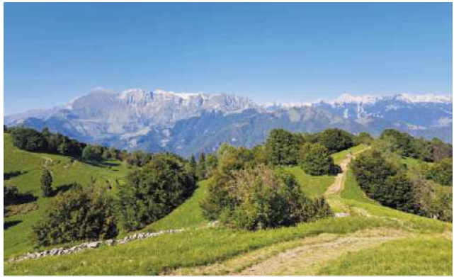
Dih jemajoče

kmetijo, na kateri uživajo kot v nebesih.