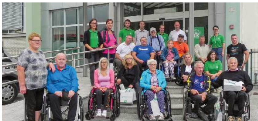
Zbrani pred Upravo TIK

Žal je vsega lepega prehitro konec in tako se je zaključilo tudi naše druženje. Piknik bomo zanesljivo ponovili tudi naslednje leto.