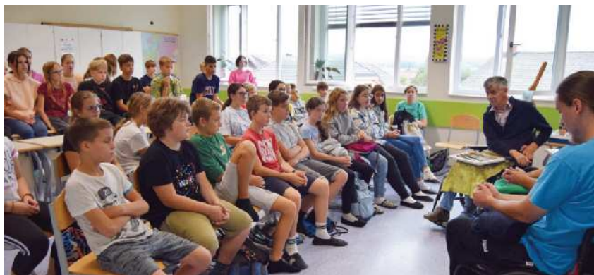
Učence na Osnovni šoli Ig smo obiskali prvič.

Projekt sofinancira Javna agencija RS za varnost prometa.