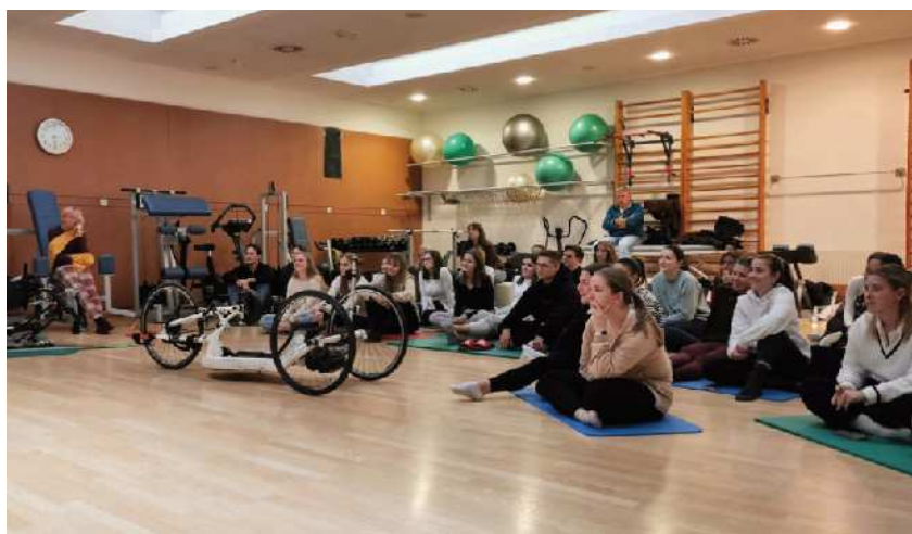
Pri študentih na zdravstveni fakulteti

Študentje v okviru predmeta delovna terapija s področja prostega časa izvajajo tudi prostovoljstvo. V desetih urah naj bi z opazovanjem, nudenjem pomoči in udeležbo pri raznih aktivnostih spoznali, kako jih izvajamo na prilagojen način (ples na vozičkih, slikanje z usti). Študentje nam v okviru teh ur lahko ponudijo tudi pomoč, npr. pri premagovanju ovir v grajenem okolju, mobilnosti, komunikaciji ... Namen predmeta je osveženost, znanje in pridobivanje spretnosti pri prilagojenih oblikah prostočasnih aktivnosti.