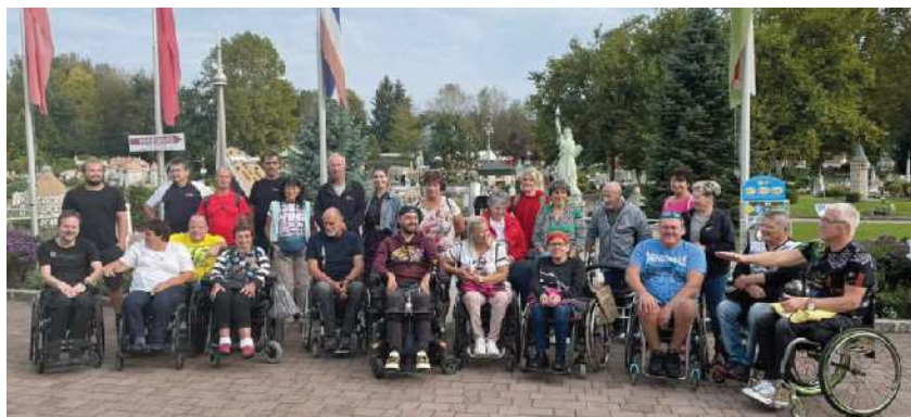
Na izletu v Avstriji

si še veliko zanimivega prebrali. Najbolj pogumni so si z vožnjo na velikem razglednem kolesu ogledali Minimundus in okolico tudi s ptičje perspektive. Po zanimivem ogledu smo si privoščili še kosilo, nato pa smo se odpeljali domov. V imenu udeležencev se zahvaljujemo organizatorjem izleta. Imeli smo se super, dobra in raznolika družba pa je naredila popotovanje še bolj nepozabno.