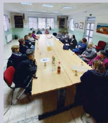
Srečanje v prostorih društva paraplegikov Novo mesto