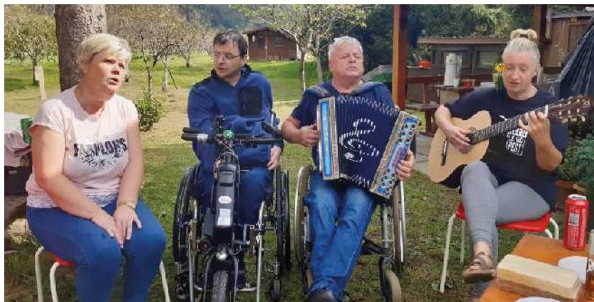
Glasbena ekipa DPSP

posladkali še s to lokalno specialiteto. Vredno bi bilo ponoviti.