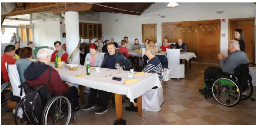
Zbrani v Gostilšču Kocjan na Bizeljskem