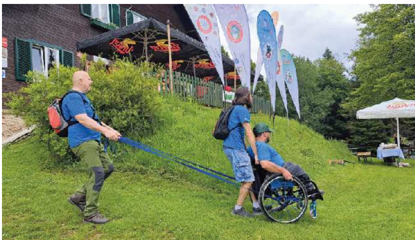
Prihod pred kočī

Vzdušje je bilo sproščeno in veselo, z glasbenim doživetjem pa ga je