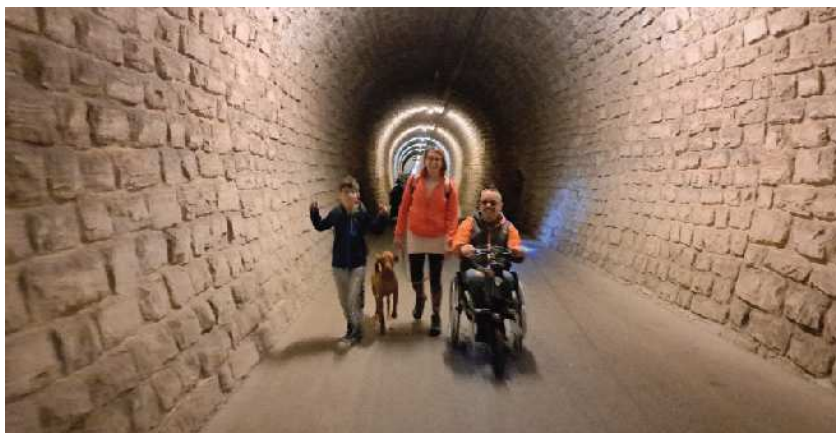
V tunelu

Od parkirišča v Strunjanu in čez prehod v krožišču na glavni cesti smo prišli na asfaltirano krajinsko cesto in kolesarsko pešpot, ki je del poti Parenzane, ta ima še več imen – Porečanka, Istrijanka. Na strunjanski strani poti, ki se blago vzpenja, je lepo urejeno počivališče z informacijsko tablo o poti. Pred predorom je še ena informacijska tabla o predoru, iz