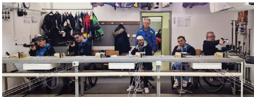
Strelci DP Ljubljana so osvojili drugo mesto.