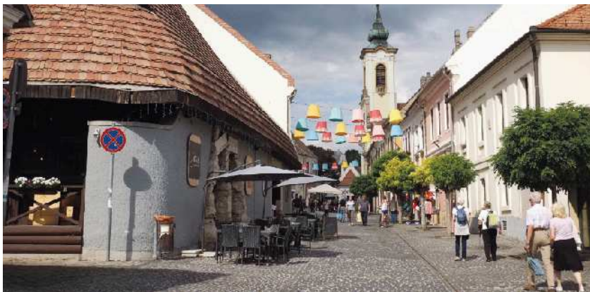
Sprehod po slikoviti vasici Szentendre

Člani društva severne Primorske smo septembra izkoristili lepo vreme in prijetne temperature za pobeg do Budimpešte, prestolnice naše vzhodne sosede Madžarske. Kljub zgodnjemu štartu je bila pot kar dolga in vožnja utrudljiva, zato je bil postanek ob Blatnem jezeru (Balaton) odlična priložnost, da smo pretegnili naše stare kosti in se nadihali svežega zraka. Predsednik nas je tudi presenetil s pravo pojedino in tako smo lahko mirno nadaljevali pot s polnimi želodčki. V Budimpešto smo prispeli v večernih urah. Potem ko smo se namestili v čudovit hotel, so se nekateri odpravili na zaslužen počitek,