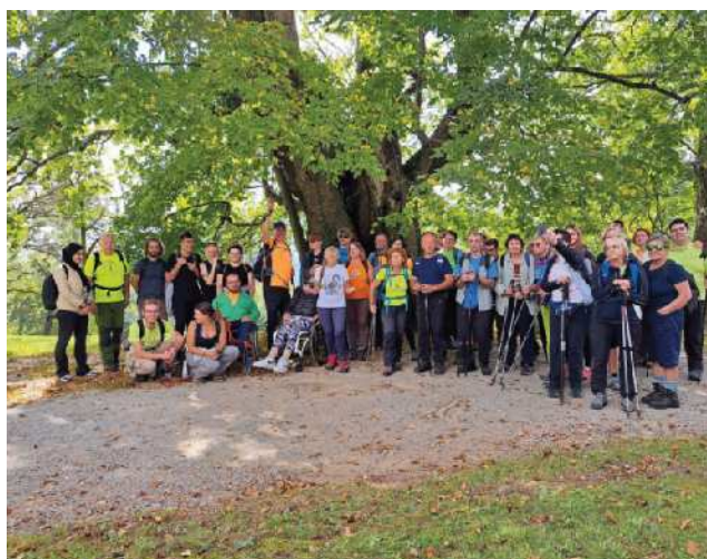
Skupinska na Šmohorju

To leto je bilo veliko prestavljanj, odpovedi in nadomestnih ciljev pohodov. Eden od največjih razlogov je bila ujma, katastrofalne poplave v začetku avgusta, zato nismo mogli izvesti pohodov na načrtovane cilje: Košenjak, Velika planina in Tromejniki.