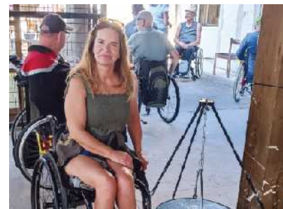
Kuhanje golaža naših članov

društva je osvojila 5. mesto. Po zboru ekip in razdelitvi sestavin se je kuhanje pričelo. Kot vsako leto je komisija na koncu tekmovanja razglasila uvrstitve. Ocenili so, da je najboljši golaž letos skuhal ekipa DP Istre in Krasa. Po tekmovanju je sledilo prijetno druženje.