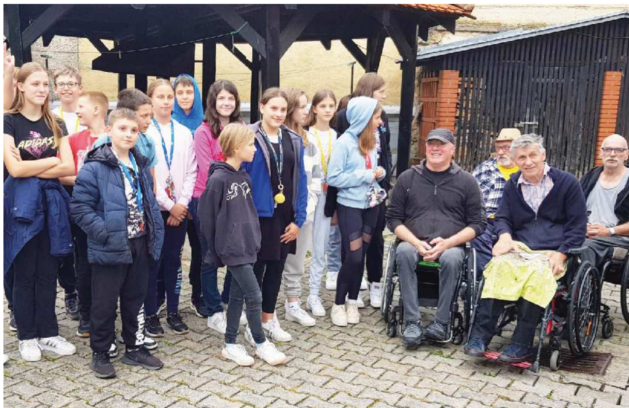
Obiskali so nas učenci OŠ Belokranjskega odreda Semič.

Likovno kolonijo je v organizaciji Zveze paraplegikov Slovenije podprl Javni sklad Republike Slovenije za kulturne dejavnosti.