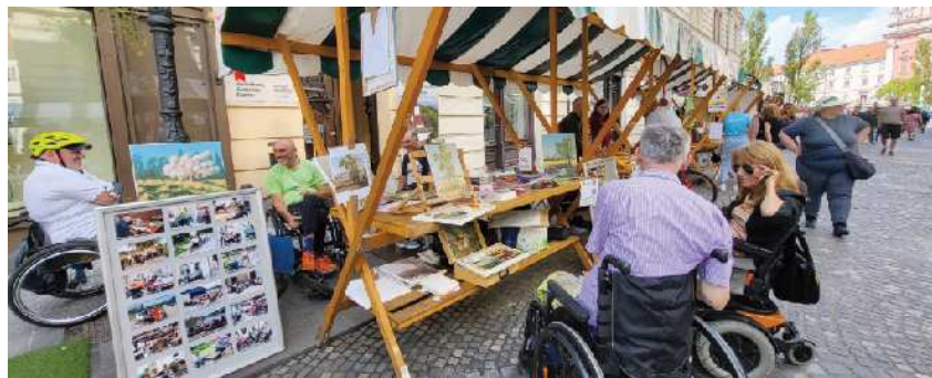
Pred stojnico našega društva na 21. festivalu Lupa