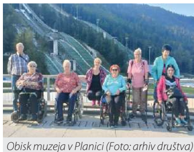
Obisk muzeja v Planici

Nato smo se utrujene, kot se za tako pester izlet spodobi, a zadovoljne, odpravile proti domu. Ponovno se iz srca zahvaljujemo šoferju Igorju , ki nas je razvajal s čokoladnimi bomboni, predvsem pa srečno pripeljal domov.