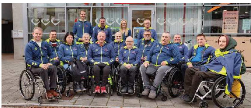
Prevzeli nova športna oblačila

O praznovanju božiča in novega leta ter o dogodkih z začetka prihodnjega leta pa več v naslednji številki.