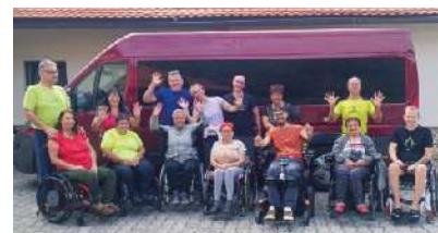
Martinova jesen v Semiču